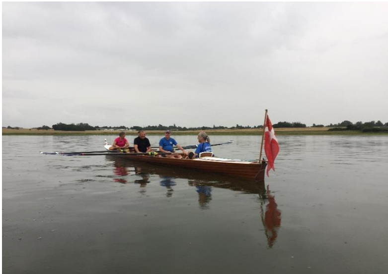
Aftentur på Tissø

Den 19.7. Orø rundt – En spontan tur for ferierende og ikke-arbejdsramte roere. 3 x 2-åres havde en fin tur i rigtig dejligt vejr, perfekt medvind på vejen hjem fra Vellerup Vig.