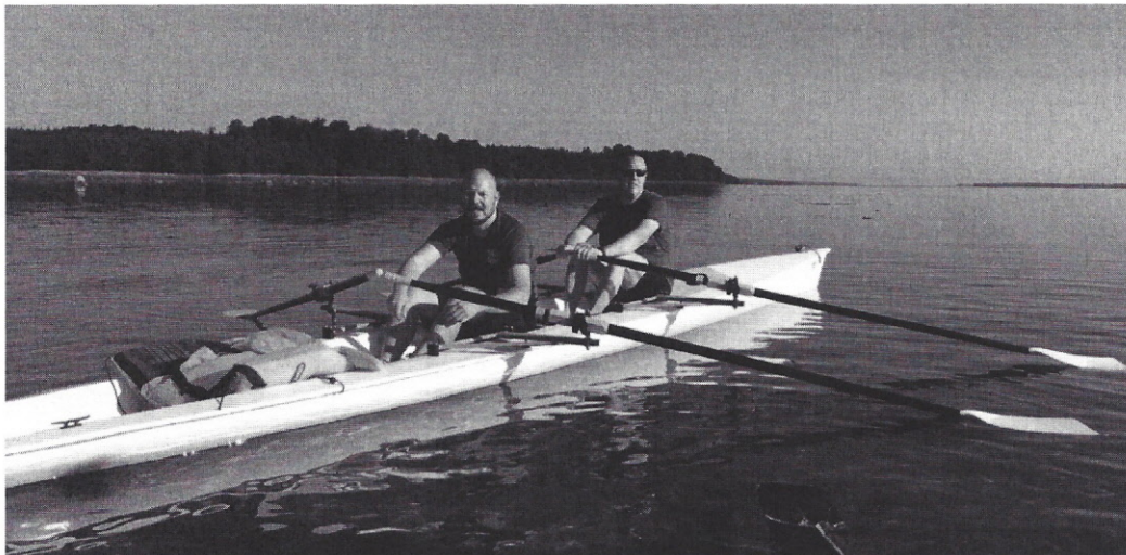
Skifte ved Munkholm