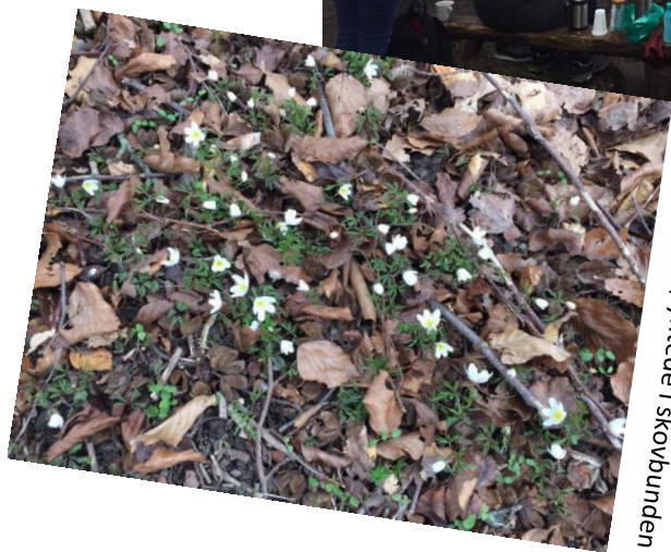
Anemonerne pyntede i skovbunden

Pas godt på jer selv og hinanden og tænk på at vi på et tidspunkt igen kan nyde denne udsigt fra vores terrasse.